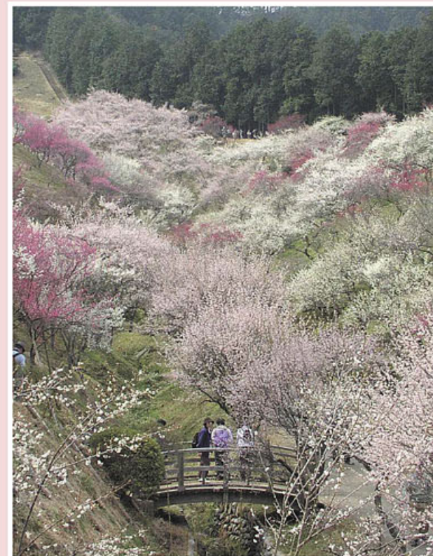
たいこ橋と西側を望む

有料開園期間 2月下旬～3月31日 (開花状況等により変更となることがあります。)